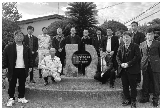
参加者全員で記念撮影

午後1時00分~ 会社紹介 午後1時30分~ 工場見学 午後2時30分~ 質疑応答