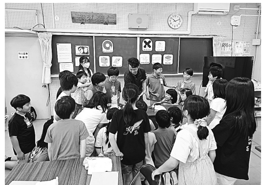
千石小学校（紙すき体験）授業の様子 / 講師：吉川祐貴氏