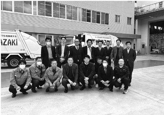
参加者記念撮影 (集合写真)

2月15日 国内研修 / (株)宮崎横浜リサイクルセンター (横浜市都筑区池辺町 3905-3) 工場見学 午後3時開始 参加者9社13名