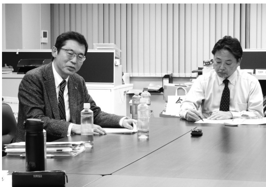
総括を述べる石川理事長 (左)