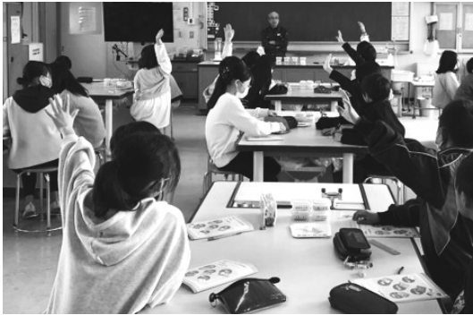
座学の様子 / 4年2組