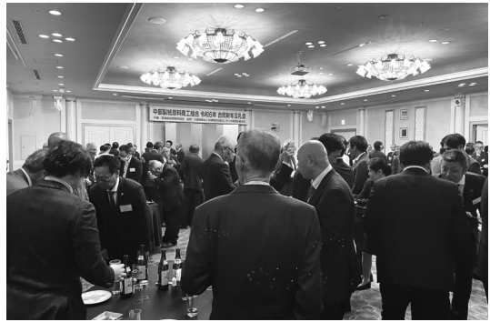
祝宴中の会場の様子