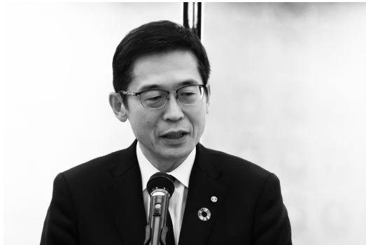
開会の辞を述べる全原連石川副理事長