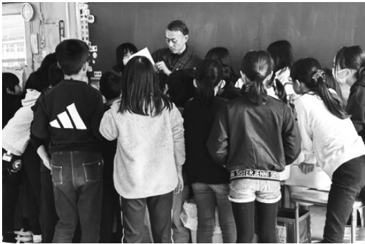
紙すき体験の説明 / 4年2組