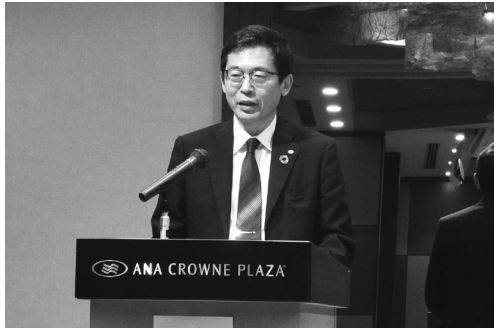
選考委員代表として選考結果（被推選人）を発表する 全原連石川副理事長（当組合理事長）