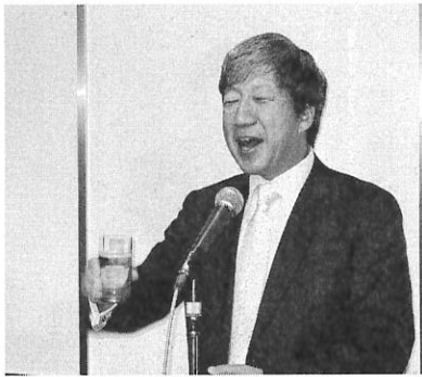
懇親会で挨拶、乾杯の音頭をとる CFC国本相談役